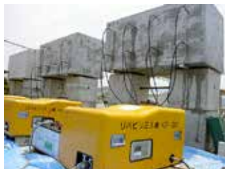
大型供試体によるASR抑制効果検証実験