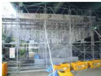
橋脚(はり部)のASR補修事例