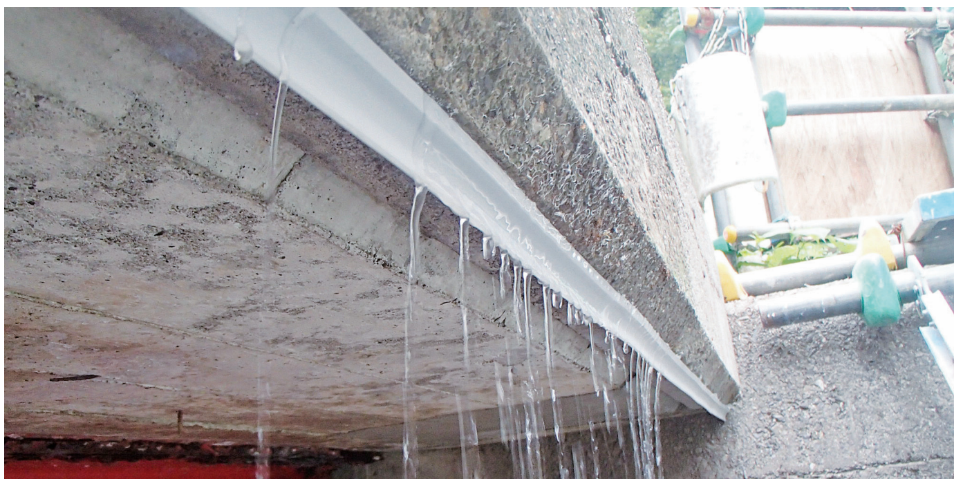
▲構造物底にウォーターカッター設置状況