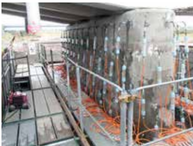
リハビリカプセル工法施工状況