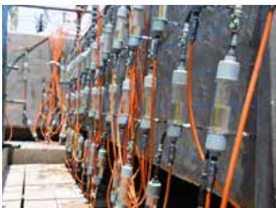
リハビリカプセル設置状況