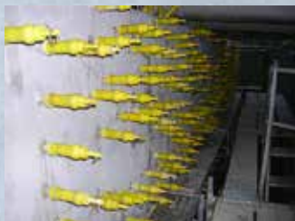
リハビリシリンダー設置状況