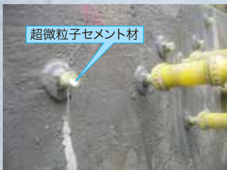
超微粒子セメント材